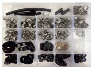
COD: ACX0007 Kit de Componentes para Manutenção e Reposição do Módulo de Combustível