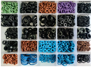
COD: ACX0002 Kit de Anéis para Manutenção e Reposição de Bico Injetor