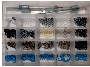
COD: ACX0003 Kit de Componentes para Manutenção e Reposição de Injetores de Injeção Direta