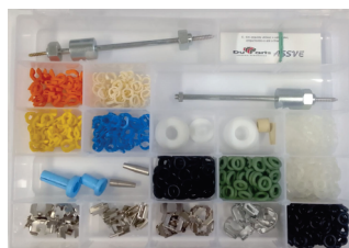
COD: ACX0009 Kit de Dispositivos para Manutenção de Bico Injetor