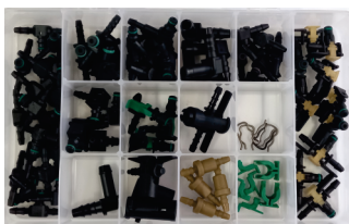
COD: ACX0008 Kit de Componentes para Manutenção e Reposição do Sistema de Retorno Diesel