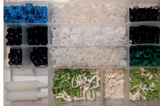
COD: ACX0005 Kit de Componentes para Manutenção e Reposição de Conectores