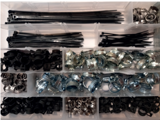
COD: ACX0006 Kit de Componentes para Manutenção de Mangueiras