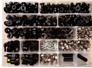
COD: ACX0001 Kit de Componentes para Manutenção e Reposição do Sistema de Partida Frio